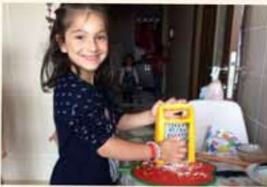
Öğrencilerimin evimi ziyareti