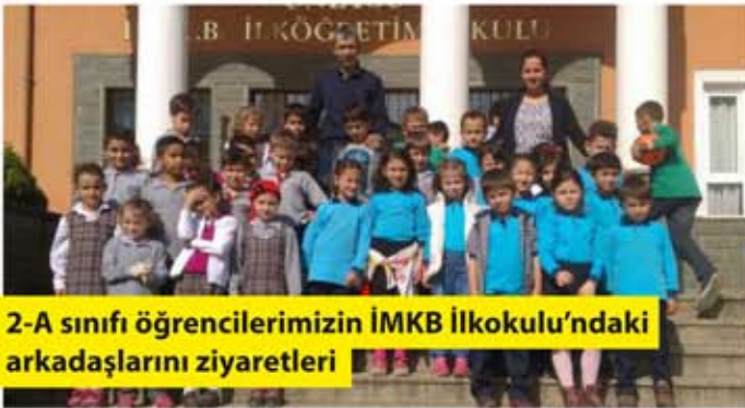
2-A sınıfı öğrencilerimizin İMKB İlkokulu'ndaki arkadaşlarını ziyaretleri