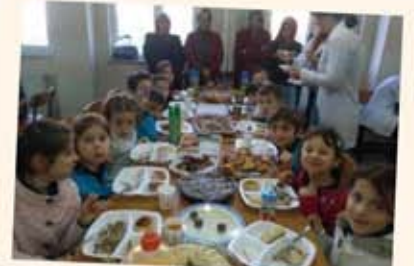
Yerli malı haftası etkinliğimiz