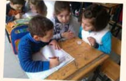
I A sınıfına okuma çalışması yaptırırken