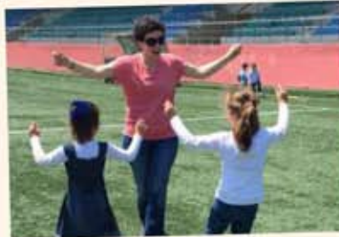
Öğretmen - Öğrenci El ele