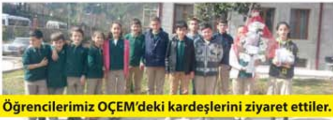
Öğrencilerimiz OÇEM'deki kardeşlerini ziyaret ettiler.