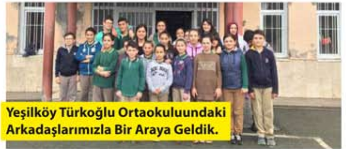
Yeşilköy Türkoğlu Ortaokulu'ndaki Arkadaşlarımızla Bir Araya Geldik.