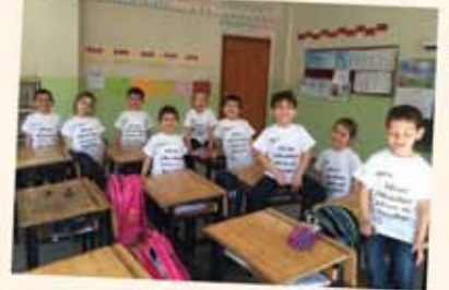
Hem okudum hem de yazdım