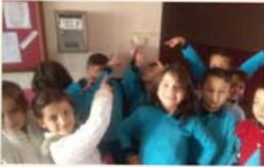
Enerji kaynaklarını tutumlu kullanma konusunda tüm okulu bilinçlendirmek için yaptığımız çalışma