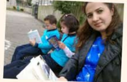
Teneffüste kitap da okuruz birlikte