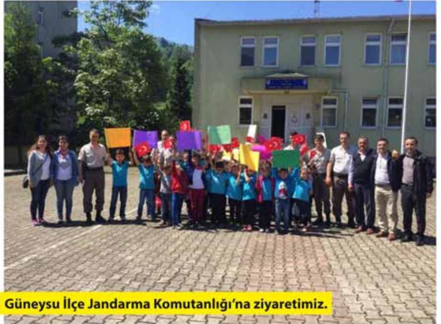
Güneysu İlçe Jandarma Komutanlığı'na ziyaretimiz.