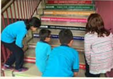
3-A okulumuz düzenlenmesine katkıda bulunuyor...