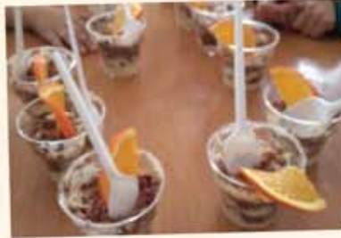
Kendi ellerimizle hazırlayıp yediğimiz cupcake