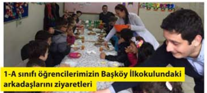
1-A sınıfı öğrencilerimizin Başköy İlkokulundaki arkadaşlarını ziyaretleri