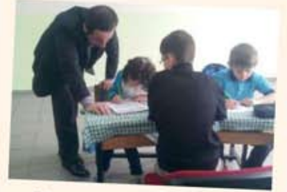
Müdür yardımcımızın dersimize yapmış olduğu ziyaret