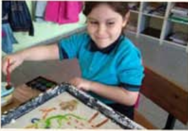
Mısır nişastası üzerine resim de yaparız