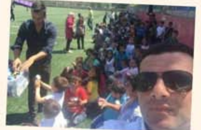
Okul pikniğimizde çok eğlendik