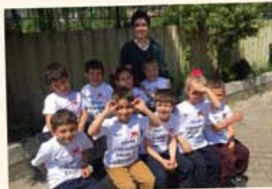
Umutla El Ele