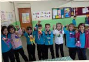
Serbest etkinlik dersinde yaptığımız kuklalarımız