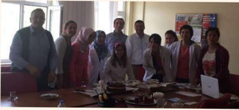
Biz Bir Ekibiz