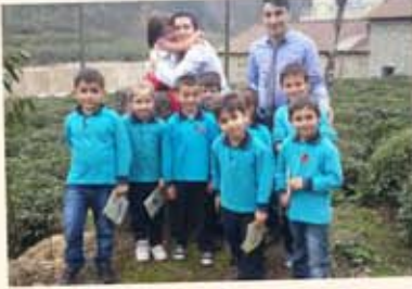
Elif Sıla'yı ziyaret