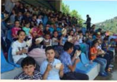
İlçemizde bulunan stadyumda doyasıya eğlendik